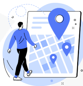
seus hábitos de deslocamento