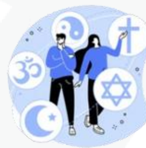
sua preferência religiosa

Agora fica fácil você compreender que o uso mal intencionado desses dados pode criar muitos problemas, como ocorre com os conhecidos golpes de boletos bancários, fraudes em contas de aplicativos, abertura indevida de contas bancárias e de consumo.