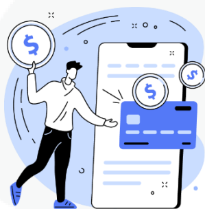
seus hábitos de consumo